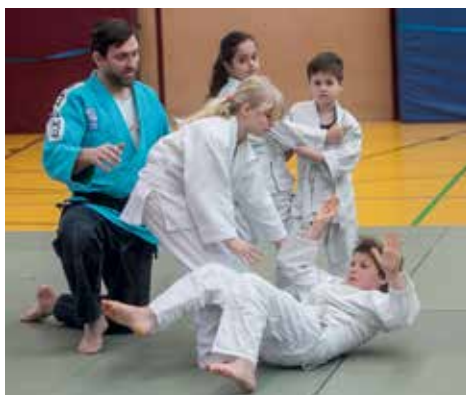
Alle Kinder tragen Judogis – schon das sorgt für Harmonie

Zum Aufwärmen spielt die Gruppe. Bekannte Sachen: Die Kinder laufen auf der Stelle und müssen auf vorher definierte Kommandos des Trainers bestimmte Bewegungen ausführen. Sukzessive steigert Helbing die Anforderung für andere eine Motivation wäre, für ihre Ideen zu kämpfen. Wir mussten auch viele Widerstände überwinden, um das Projekt auf dieses Niveau zu bringen. Wir haben nie aufgegeben. Und man sieht, es hat sich gelohnt.“ Von Vorteil erwies sich, dass die Bottroper sehr intensiven Kontakt mit allen Beteiligten pflegten und pflegen. Dokumentationen mit wissenschaftlicher