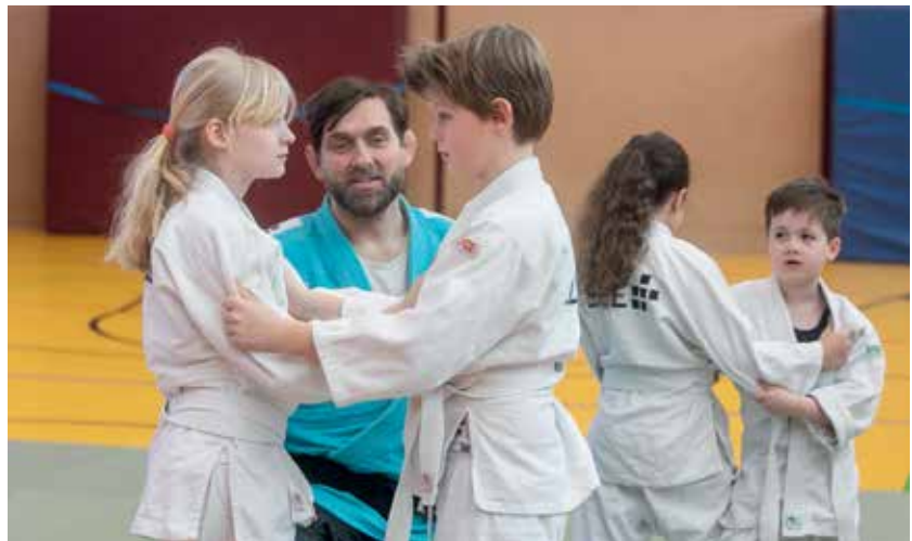
Die Kinder nennen ihn „Svensei“