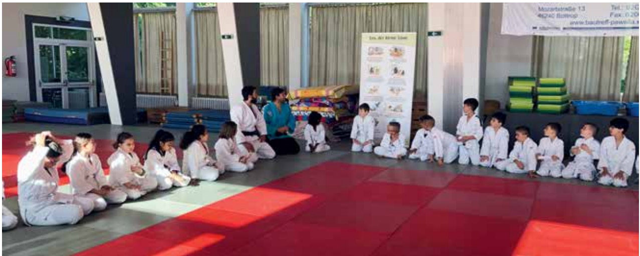
Viele Kinder werden erreicht