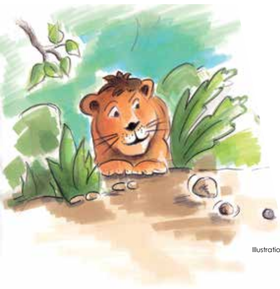
Illustrationen: Volker Tapper